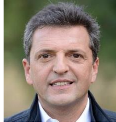
SERGIO MASSA 13,9%