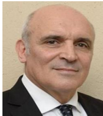
JOSÉ LUIS ESPERT 4,9%