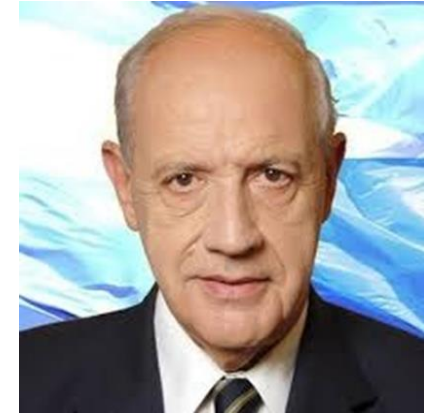
ROBERTO LAVAGNA 22,9%