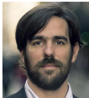
NICOLÁS DEL CAÑO 5,5%