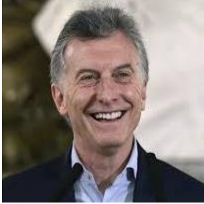
MAURICIO MACRI 30,5%