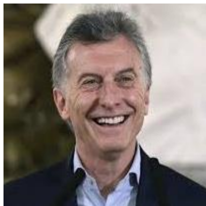
MAURICIO MACRI 21,5%