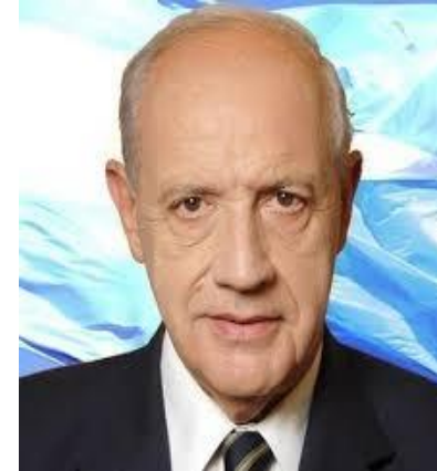
ROBERTO LAVAGNA 7,9%