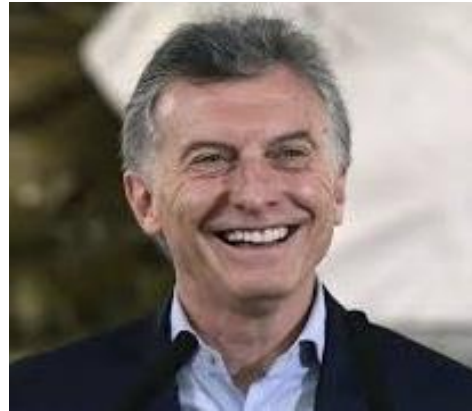
MAURICIO MACRI 26,1%