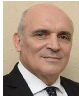
JOSÉ LUIS ESPERT