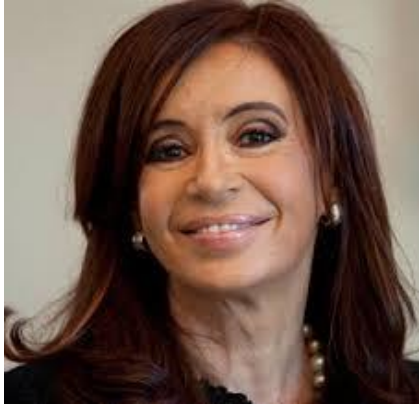
CRISTINA KIRCHNER 40,5%