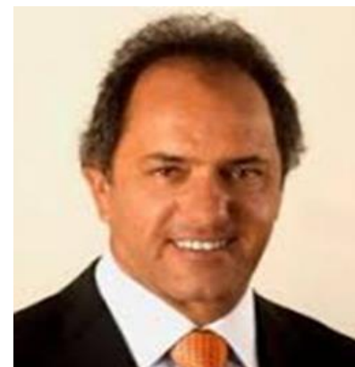
DANIEL SCIOLI 2,6%