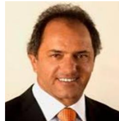
DANIEL SCIOLI 2,0%